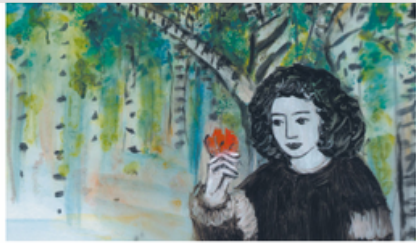
ATELIER "PEINTURE ANIMÉE" En partenariat avec Lycéens et apprentis au cinéma on Duc de la Loire